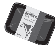
lege schaal van vlees