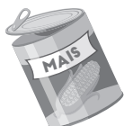
leeg conservenblik van mais